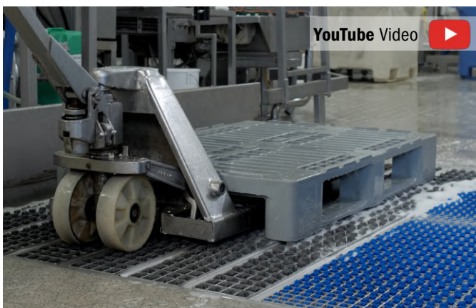
Ideal für die Unterboden-Reinigung und Desinfektion von Kunststoffpaletten und -boxen