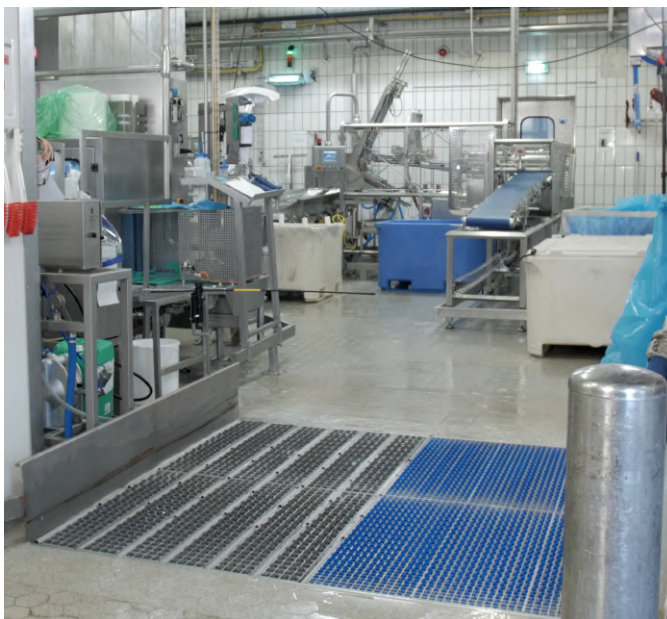
Installation in einem Molkereibetrieb